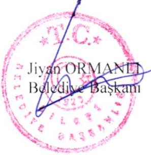
Jiyan ORMANLI Belediye Başkanı

İşbu karar Silopi Belediye Meclisininin 06.11.2024 tarihli 3. birleşiminin 1. oturumunda görüşülerek kabul edilen meclis müzakere tutanaklarına uygundur.