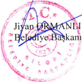
Jiyan ORMANLI Belediye Başkanı

İşbu karar Silopi Belediye Meclisinin 04.11.2025 tarihli 2. birleşimin 1. oturumunda görüşülerek kabul edilen meclis müzakere tutanaklarına uygundur.