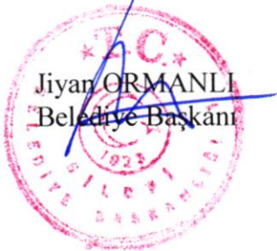
Jiyan ORMANLI Belediye Başkanı

İşbu karar Silopi Belediye Meclisinin 03.11.2025 tarihli 1. birleşimin 1. oturumunda görüşülerek kabul edilen meclis müzakere tutanaklarına uygundur.